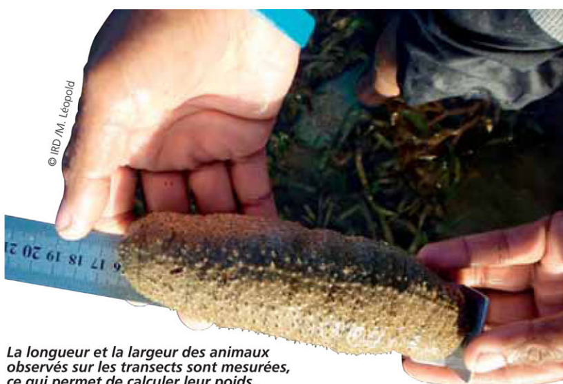
La longueur et la largeur des animaux observés sur les transects sont mesurées, ce qui permet de calculer leur poids.

Le projet Cogeron réunit l'IRD et plusieurs acteurs néo-calédoniens. Il vise notamment à l'étude de la pêche à l'holothurie. Cet invertébré marin voit aujourd'hui s'exercer sur ses stocks une pression préoccupante.